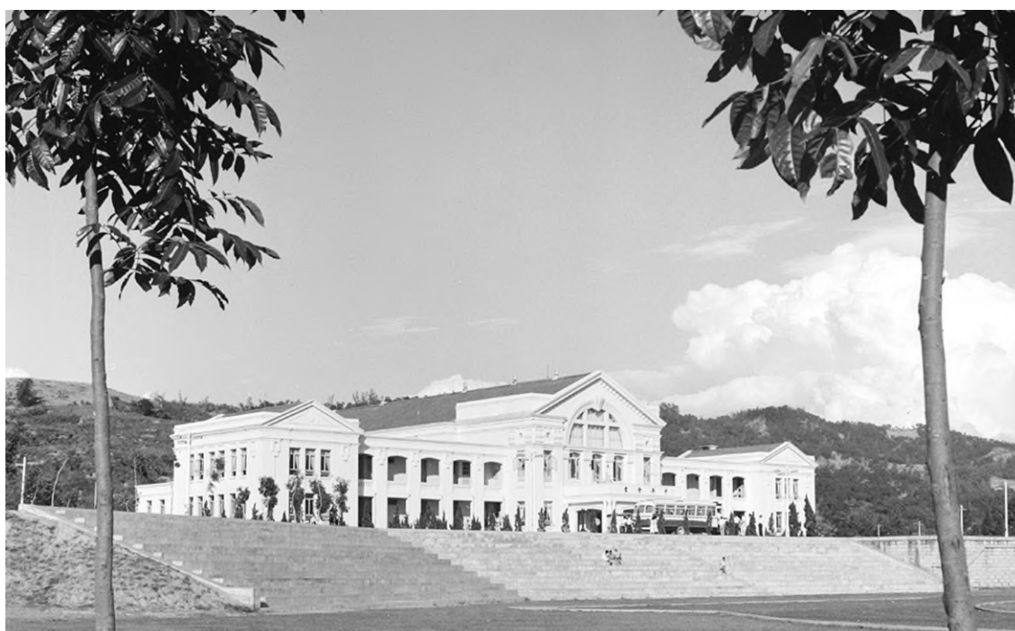
中興會堂 50 年代老照片