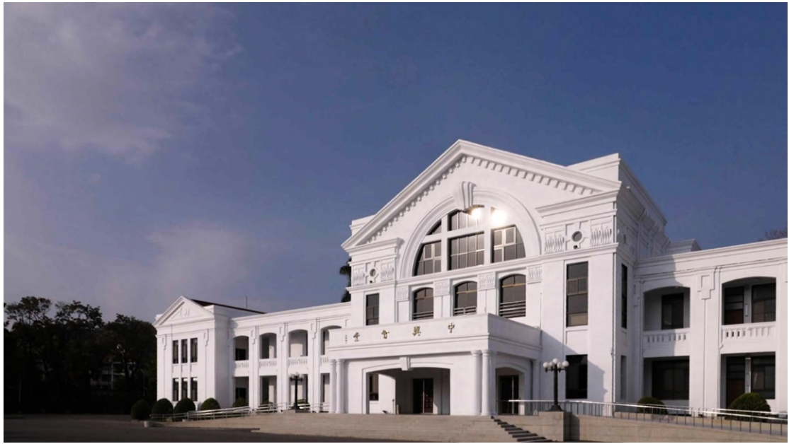
中興會堂完工後照片 (日間)