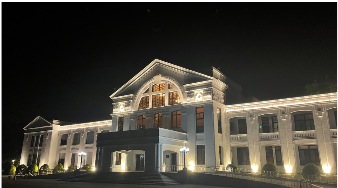
中興會堂完工後照片 (夜間)