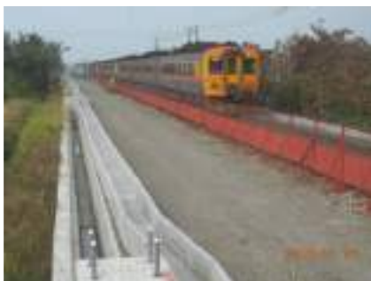
▲ 社補路(由南往北拍照)(纜線槽水溝電車線基礎施工)

鐵路建設一直扮演促進經濟繁榮的重任，透過基礎建設可以延伸到無限的幸福與期待，隨著經濟成長與旅運需求導向與能源政策，鐵路運輸不僅擔任運輸動脈之重責大任外，更是結合地方政府共同帶動城市更新的發展，使鐵路車站結合地標地景、觀光休閒及特色意象等具備多元發展願景，讓鐵路運輸成為最舒適、最安全及最便捷的大眾運輸交通工具。而建構環島鐵路電氣化路網是國家努力推動的政策，其中行政院更在2013年6月3日核定「南迴線及屏東線潮州至枋寮段」計畫，請交通部鐵路改建工程局優先完成電氣化路網，減少廢氣排放，逐步建構全島永續綠色大眾運輸，提供國人更平安舒適回家的鐵路運輸服務。整個計畫經費約新臺幣276億元，期程自2013年7月至2022年3月止，路線總長約123公里(南迴線西起枋寮站，東至臺東站，全長約98公里；潮州枋寮段北起潮州站，南至枋寮站，全長約25公里)。