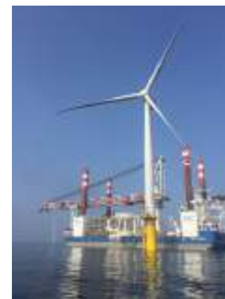
▲ 位於苗栗外海首座離岸示範風機