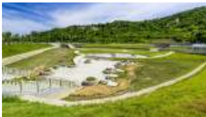
▲ 柴山滯洪池面積2.4公頃，滯洪量6.5萬噸，改善鼓山淹水外，咕硎石融入地質樣貌及牛稠子文化遺址保留，結合在地文化