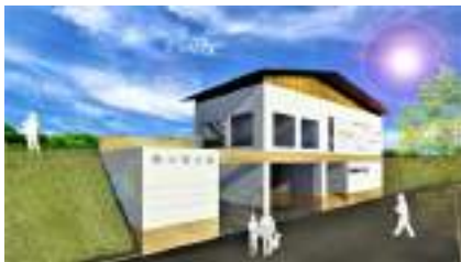
▲ 新建新光抽水站。抽水量6CMS，提高河道防洪保護標準，並結合地景環境改造以創造水岸生態居住環境，預計2018年7月完工

水利局持續進行治水工程，歷年來累積相當多的實務操作經驗、結合民眾意見加以歸納創新並應用於陸續建設完成的滯洪池。如今至2018年底預計完成15座滯洪池，總蓄洪量約326.6萬噸，現階段整體淹水面積已較2010年減少約6,352公頃，高居全國之冠。後續高雄市政府水利局將廣續辦理各項治水改善工程、積極向中央爭取治水經費挹注，打造高雄市成為防洪抗災之韌性城市。