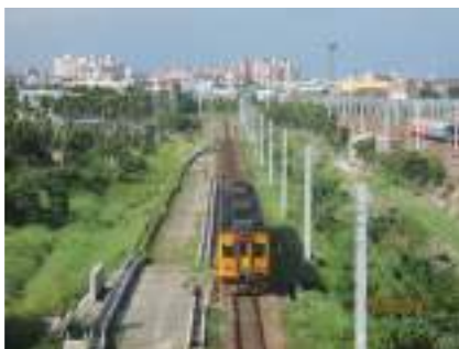
▲ 潮州跨越橋(由南往北拍照)(纜線槽水溝電車線基礎施工)